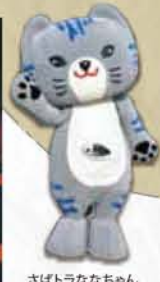
さばトラななちゃん(小浜市)