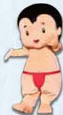
赤ふん坊や(高浜町)