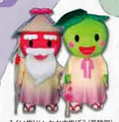
ふくい梅じい・わかさ梅ぼう(若狭町)

小浜市 福井県立若狭歴史博物館 昨年7月に施設の展示等を一新し、歴史文化の宝庫である「若狭」を学び楽しむ新たな歴史・文化観光拠点としてリニューアルオープン。若狭を特徴づける「仏像」「祭り」の展示やターヘル・アナトミアや解体新書といった歴史資料は必見です。 ■料金/一般:300円/高校生以下・満70歳以上・身障者手帳等をお持ちの方は無料 ■時間/9:00~17:00 ■休/1/26、2/9、2/23、3/9、3/23 ■所/小浜市遠敷2丁目104 ■問/0770-56-0525 ■アクセス/小浜ICから車で5分